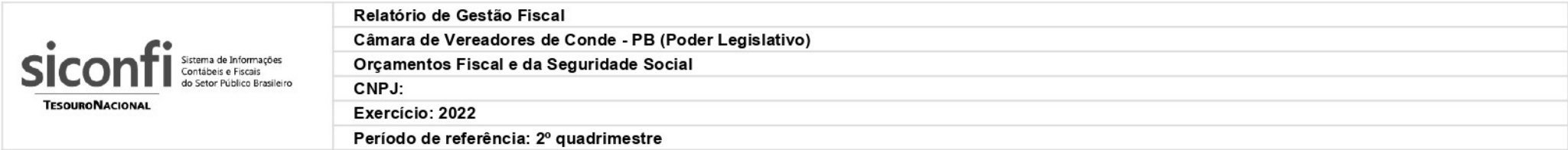
RGF-Anexo 01 | Tabela 1.2 - Trajetória de Retorno ao Limite da Despesa Total com Pessoal